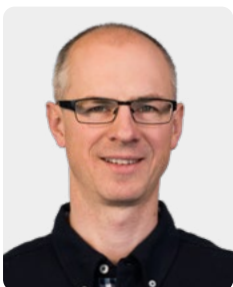
WALDEMAR ISAAK Service / Reparaturen