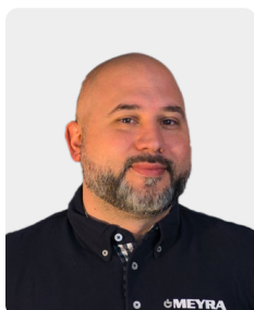
SENOL DELI Kundenbetreuung

Tel. +49 571 93292 - 504 Fax +49 571 93292 - 9504